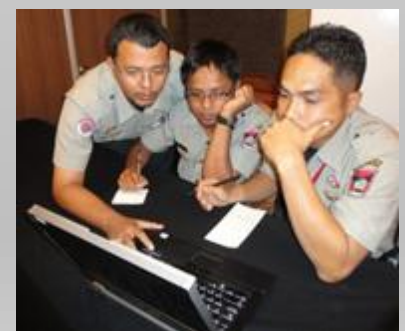
Berlatih memanfaatkan WRS