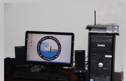
Warning Receiver System (WRS)